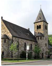
St. Elisabeth Benolpe

Die Frauengemeinschaft lädt herzlich zur Klön-Runde am Dienstag, 14. Januar ins Pfarrheim ein. Beginn ist um 15.00 Uhr.