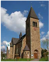
Herz Jesu Albaum