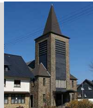
St. Antonius Eins. Hofolpe