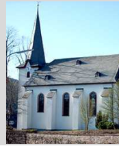
St. Katharina Heinsberg

Das Friedenslicht aus Bethlehem wird in der Messe am 22. Dezember um 9.00 Uhr in der Pfarrkirche Herz Jesu Albaum ausgegeben. Jeder, der dieses Licht mit nach Hause nehmen möchte, möge bitte eine Laterne mitbringen.